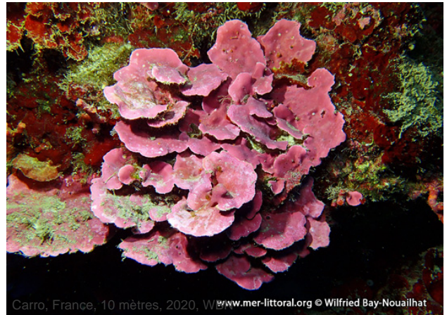
Carro, France, 10 mètres, 2020