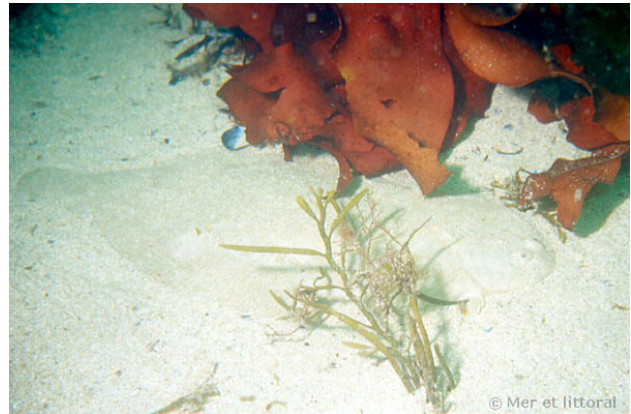
Iles Glénan, France, 11 mètres, 2004, WBN

Textes de Anne Bay-Nouailhat © 2004 - 2024