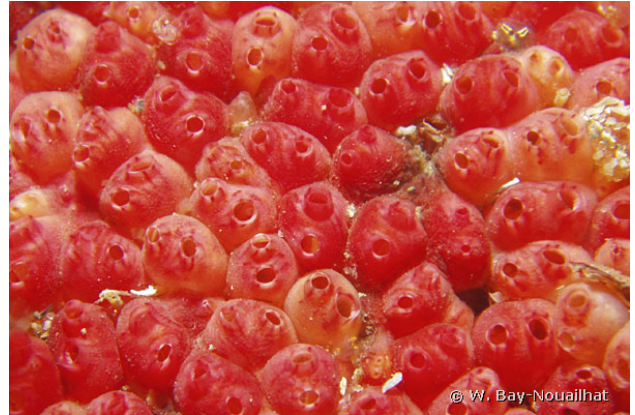
Camaret, France, 9 mètres, 2011, WBN

Textes de Anne Bay-Nouailhat © 2007 - 2025