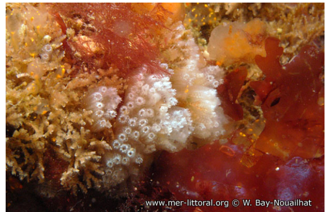
Camaret, France, 20 mètres, 2011, WBN