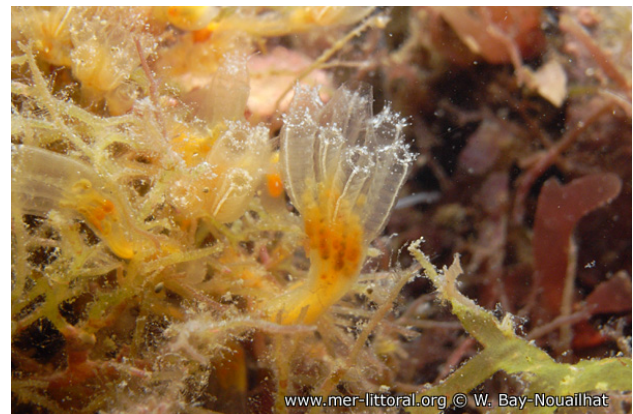
Rade de Brest, France, 10 mètres, 2011, WBN