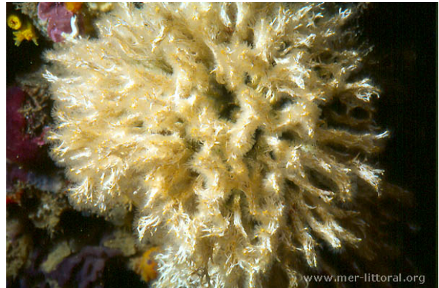
Illes Medes, Espagne, 16 mètres, 2005, WBN

Textes de Anne Bay-Nouailhat © 2006 - 2024