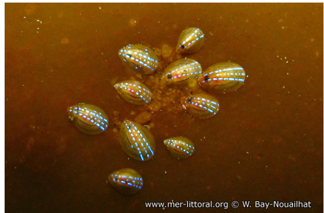
Baie de Concarneau, France, 4 mètres, 2008, WBN