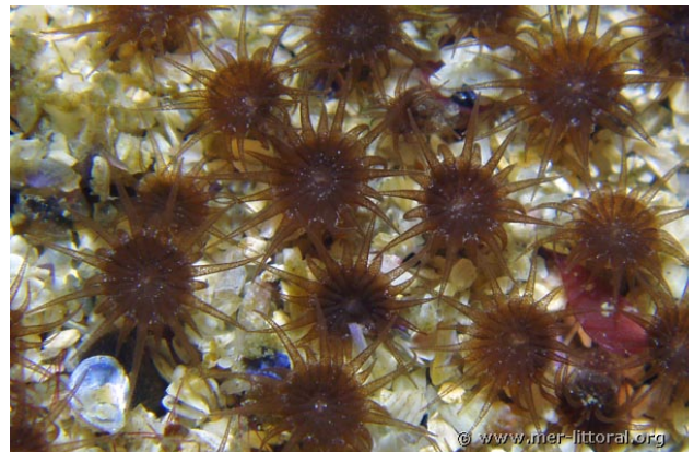
Baie de Lannion, France, 18 mètres, 2006, WBN