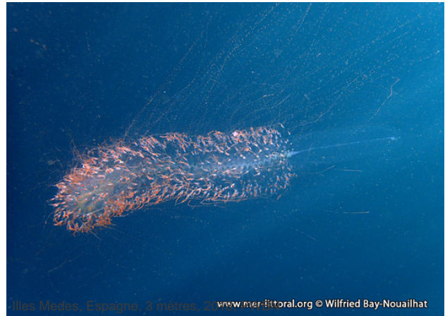
Illes Medes, Espagne, 3 mètres, © www.mer-littoral.org © Wilfried Bay-Nouailhat

Textes de Wilfried Bay-Nouailhat © 2006 - 2024