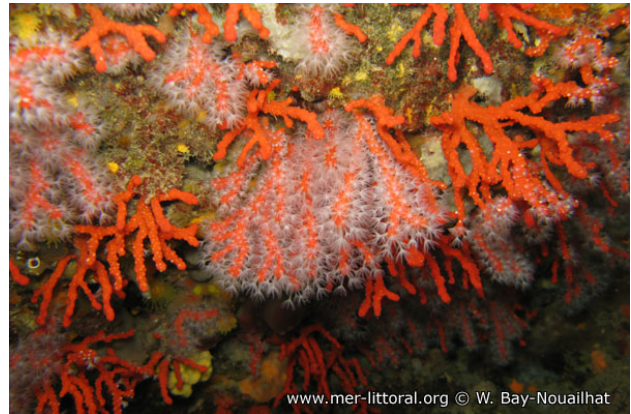
Illes Medes, Espagne, 15 mètres, 2008, WBN

Textes de Wilfried Bay-Nouailhat © 2005 - 2024