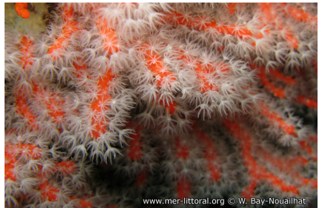
Illes Medes, Espagne, 14 mètres, 2008, WBN