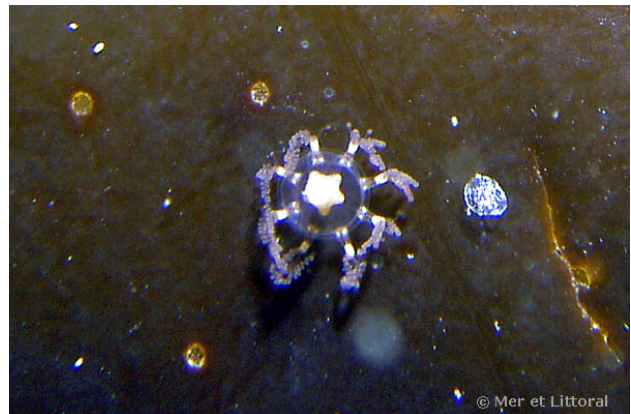
Baie de Concarneau, France, 5 mètres, 2004, WBN