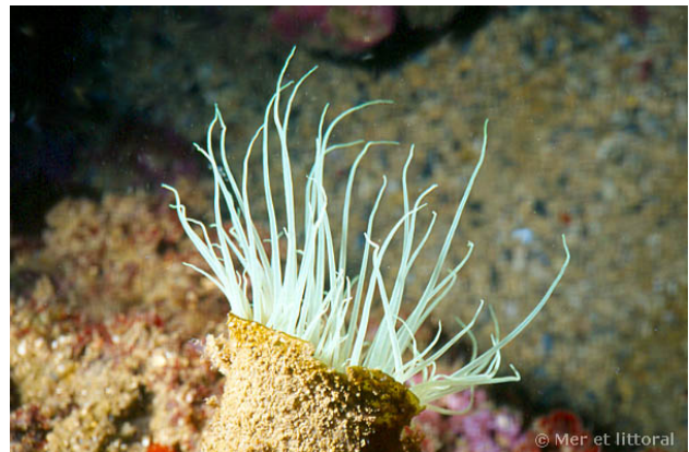
Illes Medes, Espagne, 10 mètres, 2004, WBN