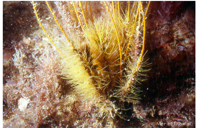
Iles Glénan, France, 15 mètres, 2004, WBN