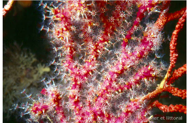
Illes Medes, Espagne, 17 mètres, 2004, WBN

Textes de Wilfried Bay-Nouailhat © 2005 - 2024