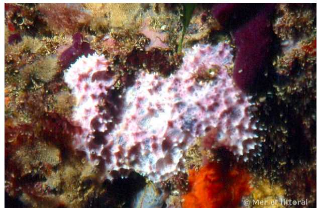
Illes Medes, Espagne, 12 mètres, 2004, WBN