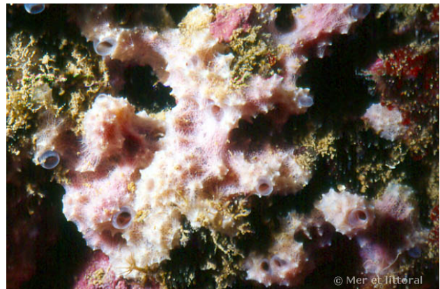
Illes Medes, Espagne, 14 mètres, 2004, WBN