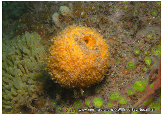
Ria d'Étel, France, 10 mètres, 2011, www.mer-littoral.org © Wilfried Bay-Nouailhat