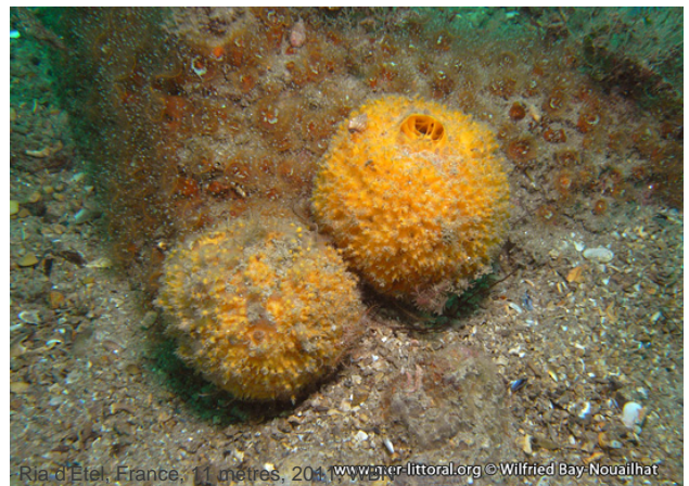
Ria d'Étel, France, 11 mètres, 2011