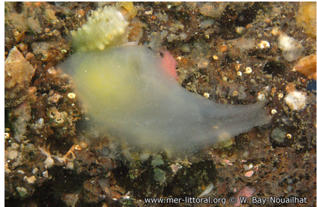
Rade de Brest, France, 3 mètres, 2011, WBN

Textes de Anne Bay-Nouailhat © 2009 - 2026