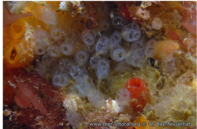
Rade de Brest, France, 7 mètres, 2011, WBN

Textes de Anne Bay-Nouailhat © 2009 - 2026