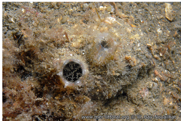
Rade de Brest, France, 8 mètres, 2011, WBN