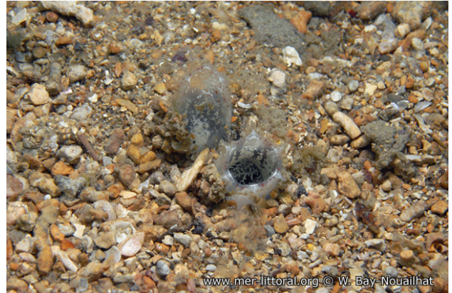
Rade de Brest, France, 9 mètres, 2011, WBN

Textes de Anne Bay-Nouailhat © 2011 - 2026