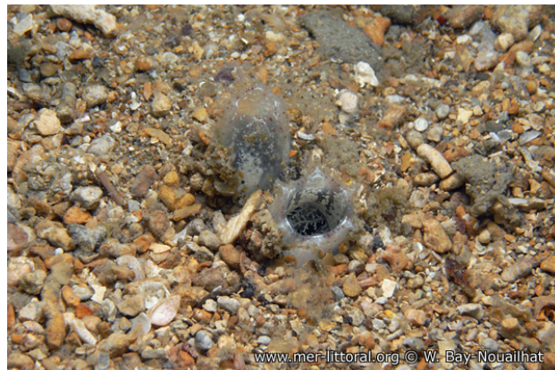
Rade de Brest, France, 9 mètres, 2011, WBN

Textes de Anne Bay-Nouailhat © 2011 - 2026