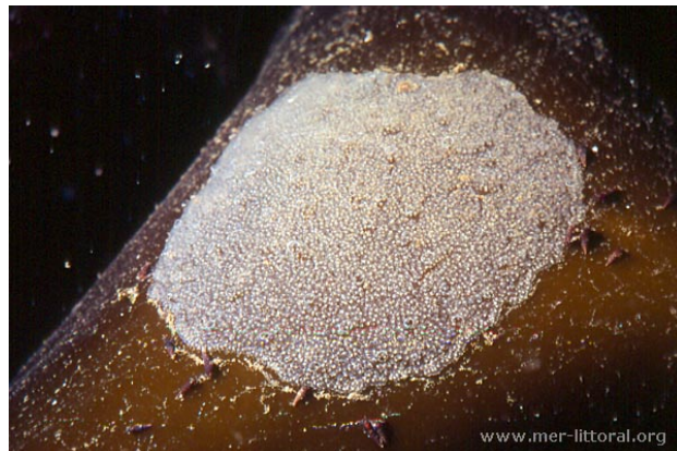
Baie de Concarneau, France, 2 mètres, 2011, WBN

Textes de Anne Bay-Nouailhat © 2007 - 2026