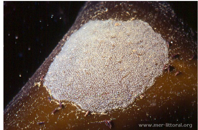
Baie de Concarneau, France, 2 mètres, 2011, WBN

Textes de Anne Bay-Nouailhat © 2007 - 2026