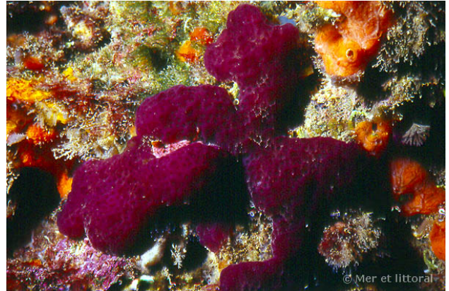
Illes Medes, Espagne, 5 mètres, 2011, WBN

Textes de Anne Bay-Nouailhat © 2007 - 2026