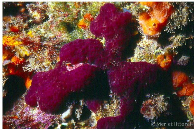
Illes Medes, Espagne, 5 mètres, 2011, WBN

Textes de Anne Bay-Nouailhat © 2007 - 2026