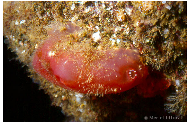
Iles Glénan, France, 14 mètres, 2011, WBN

Textes de Anne Bay-Nouailhat © 2005 - 2026