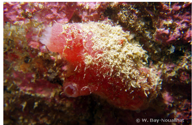
Baie de Lannion, France, 10 mètres, 2011, WBN