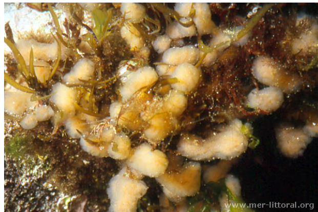
Iles Glénan, France, 4 mètres, 2011, WBN

Textes de Anne Bay-Nouailhat © 2007 - 2026