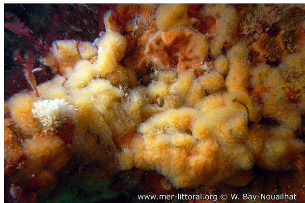
Camaret, France, 20 mètres, 2011, WBN