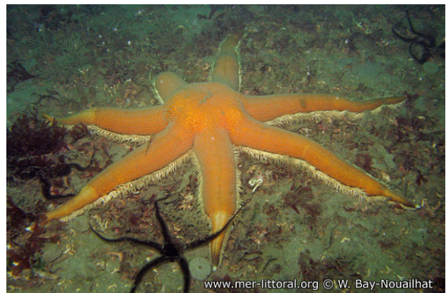
www.mer-littoral.org © W. Bay-Nouailhat Baie de Concarneau, France, 14 mètres, 2008, WBN