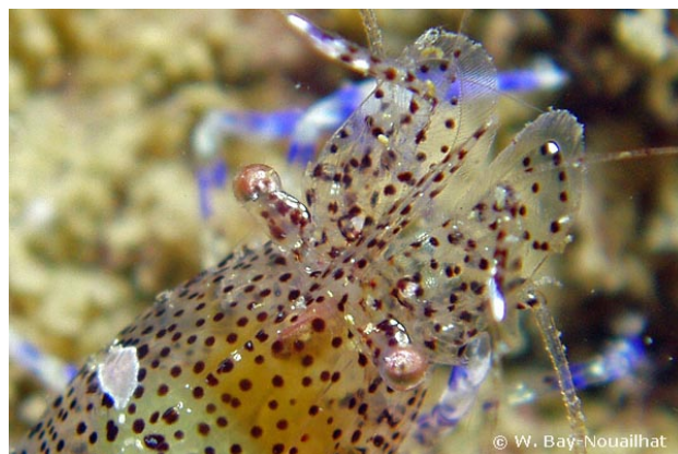
Vue rapprochée, 2006, WBN