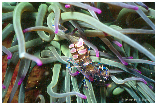
Baie de Concarneau, France, 9 mètres, 2005, WBN