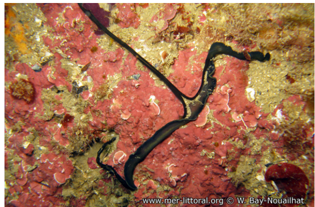
Illes Medes, Espagne, 22 mètres, 2008, WBN