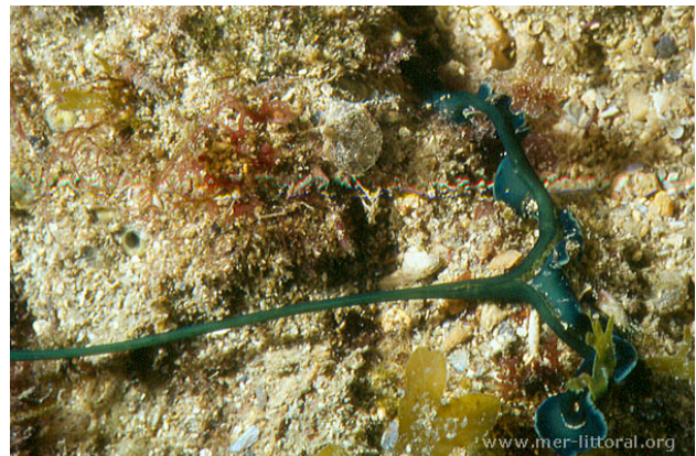
Illes Medes, Espagne, 12 mètres, 2005, WBN