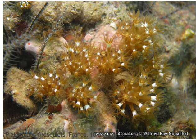
Plateau des Arasquiers, France, 10 mètres, 2009

Textes de Wilfried Bay-Nouailhat © 2009 - 2026