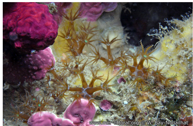
www.mer-littoral.org © W. Bay-Nouailhat

Illes Medes, Espagne, 14 mètres, 2009, WBN