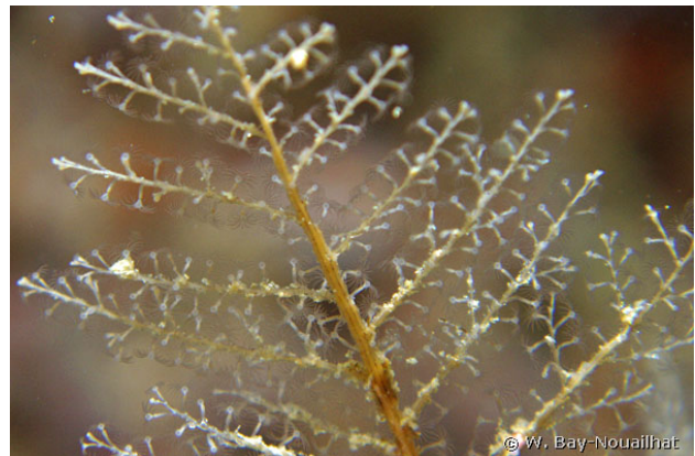
Iles Glénan, France, 10 mètres, 2007, WBN