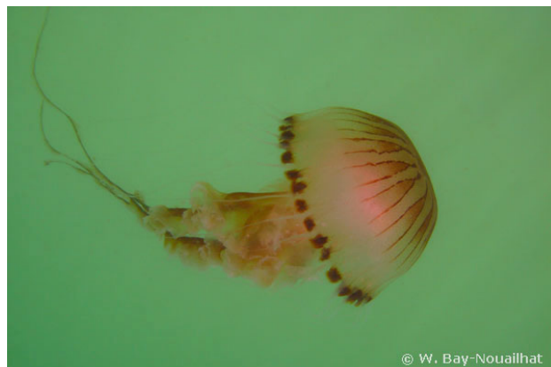
Iles Glénan, France, 1 mètre, 2008, WBN