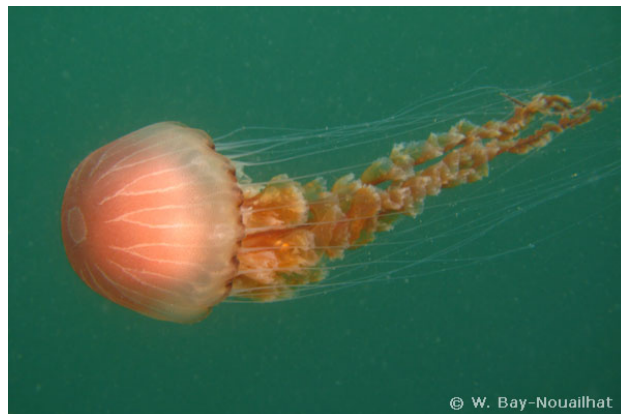
Iles Glénan, France, 1 mètre, 2008, WBN