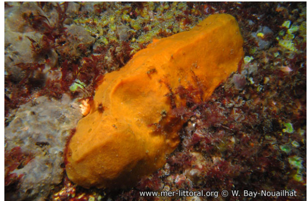
Large de Corrubedo, Espagne, 28 mètres, 2009, WBN

Textes de Wilfried Bay-Nouailhat © 2009 - 2026