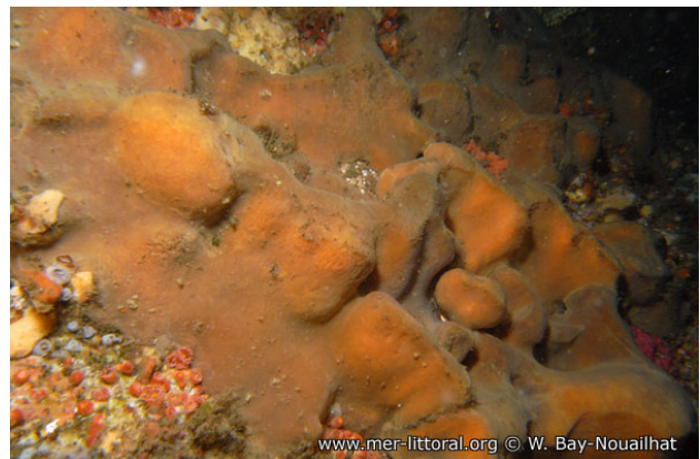
Large de Corrubedo, Espagne, 28 mètres, 2009, WBN