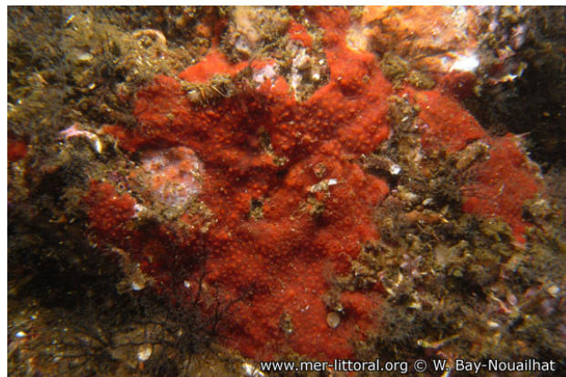
Ria de Arosa, Espagne, 12 mètres, 2009, WBN