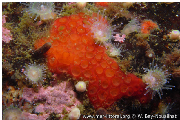
Ria de Arosa, Espagne, 20 mètres, 2009, WBN