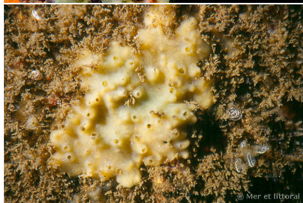
Port Manec'h, France, 3 mètres, 2004, WBN