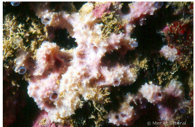
Illes Medes, Espagne, 14 mètres, 2004, WBN